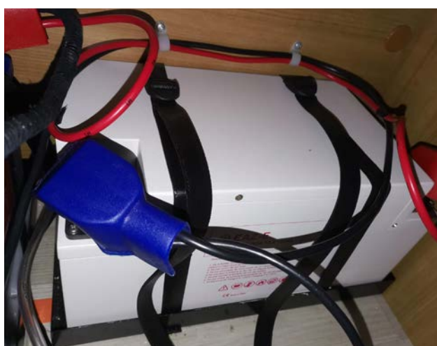
APRÈS : batterie EAZ-E installée