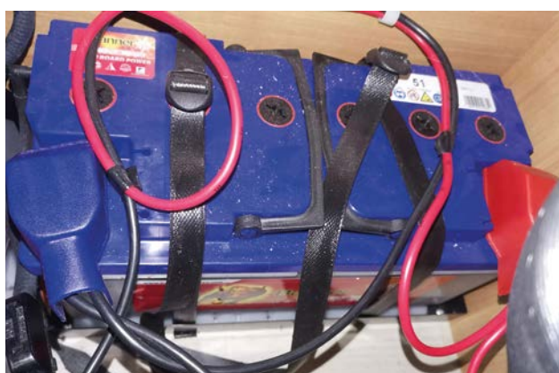
AVANT : batterie plomb installée