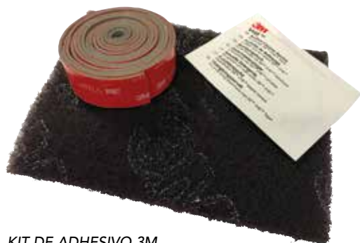
KIT DE ADHESIVO 3M Ref. 479917

Para acceder a la versión digital, escanee este código QR.